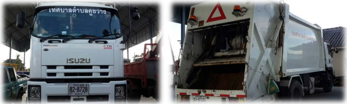
รถเก็บขนขยะมูลฝอยของเทศบาลตำบลคูขวาง

อัตราค่าธรรมเนียมในการให้บริการเก็บขนขยะมูลฝอย