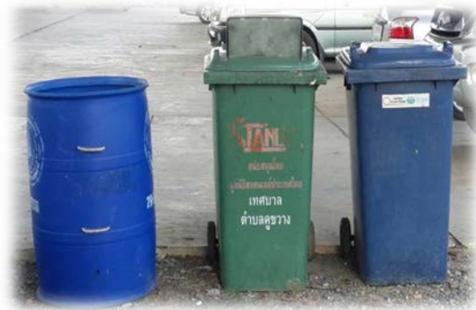
ถังขยะมูลฝอยของเทศบาลตำบลคูขวาง