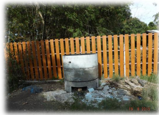
การเผาขยะมูลฝอยแบบกองบนพื้นและการเผาขยะมูลฝอยโดยใช้เตาเผาอย่างง่าย พื้นที่องค์การบริหารส่วนตำบลนพรัตน์