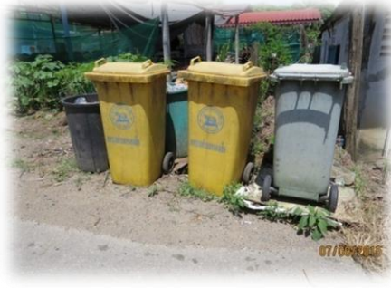
ถังขยะมูลฝอยและจุดตั้งถังขยะมูลฝอย ในพื้นที่เทศบาลตำบลหนองเสือ