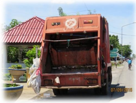
รถเก็บขนขยะมูลฝอยของเทศบาลตำบลหนองเสือ รถประเภทอัดท้าย ความจุ 10 ลูกบาศก์เมตร