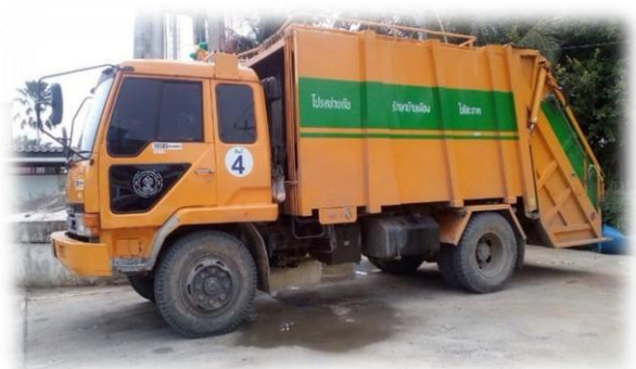
รถเก็บขนขยะมูลฝอยขององค์การบริหารส่วนตำบลคลองหก