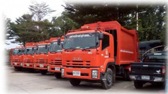
รถเก็บขนขยะมูลฝอยขององค์การบริหารส่วนตำบลคลองสาม