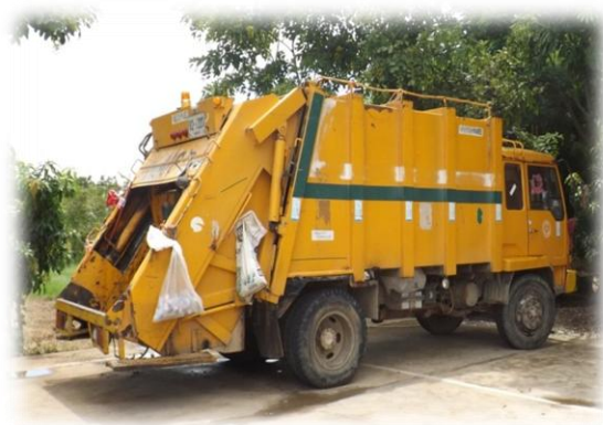
ถังขยะมูลฝอยและรถเก็บขนขยะมูลฝอยขององค์การบริหารส่วนตำบลบึงกาสาม