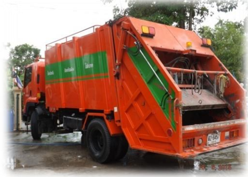
รถเก็บขนขยะมูลฝอยขององค์การบริหารส่วนตำบลบึงบอน