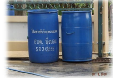
ถังขยะมูลฝอยขององค์การบริหารส่วนตำบลบึงบอน